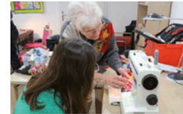
Kreislaufwirtschaft stärken: Reparieren statt wegwerfen

Im Magazin aktuell des Verbands baden-württembergischer Wohnungs- und Immobilienunternehmen e.V. mit dem Schwerpunktthema „Kreislaufwirtschaft im Wohnungsbau“ ist ein Artikel zu unseren Repair Cafés in Stuttgart-Fasanenhof und Stuttgart-Plieningen erschienen. Jetzt lesen: Kreislaufwirtschaft stärken – Reparieren statt wegwerfen .