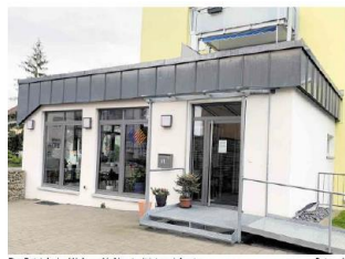
Der Betrieb des Wohncafés Vorstadt ist gesichert.