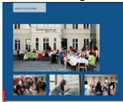
44 Ideen für gute Nachbarschaft Ein Werkzeugkoffer für alle, die Nachbarschaften aktiv mitgestalten wollen

„Ein Werkzeugkoffer für alle, die Nachbarschaften aktiv mitgestalten wollen“ ist eine tolle Publikation der Stiftung Mitarbeit, auf die wir Sie an dieser Stelle aufmerksam machen möchten. Die Autorin stellt ausgewählte Werkzeuge der Nachbarschaftsarbeit vor, die sich in der Praxis bewährt haben und vermittelt Ideen zur Beteiligung der Menschen vor Ort.